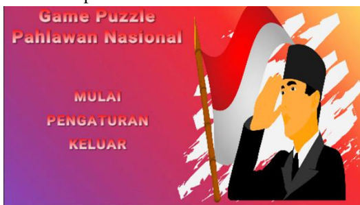
Gambar 4.1 Menu utama

Menu utama merupakan bagian awal ketika kita memasuki permainan.