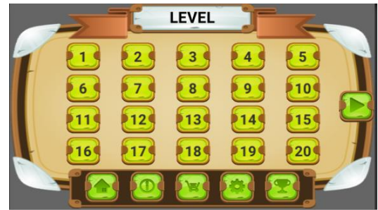
Gambar 4.2 Menu level

Pada bagian ini pemain harus menyelesaikan level 1 dahulu sebelum membuka level berikutnya